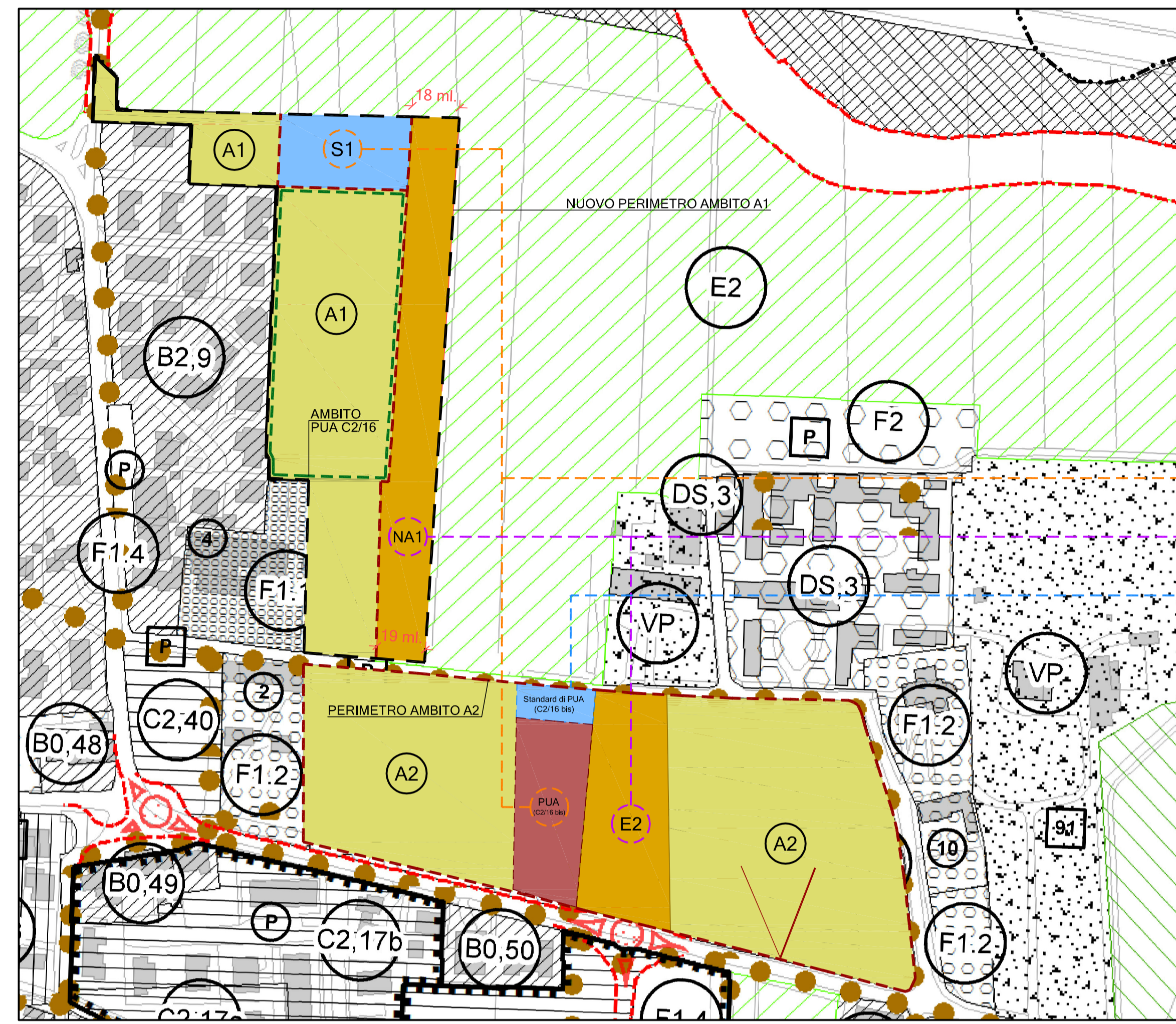
ESTRATTO DI VARIANTE AL PIANO REGOLATORE GENERALE CON INDIVIDUAZIONE DELLE SUPERFICI DI COMPENSAZIONE